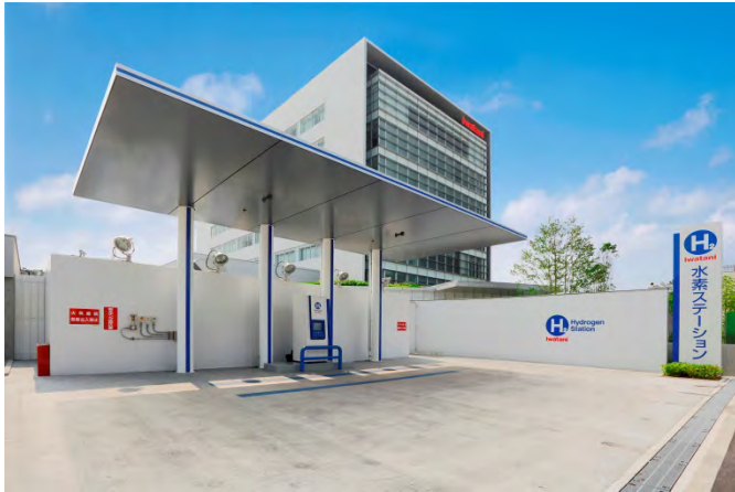
尼崎水素ステーション（岩谷産業(株)殿）