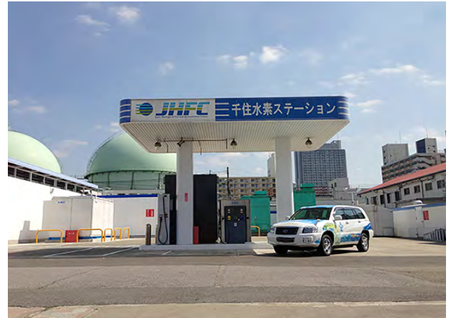
千住水素ステーション（東京ガス(株)殿）